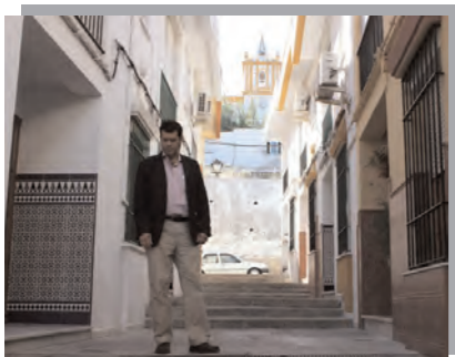
Mal estado C/ Joselito El Gallo