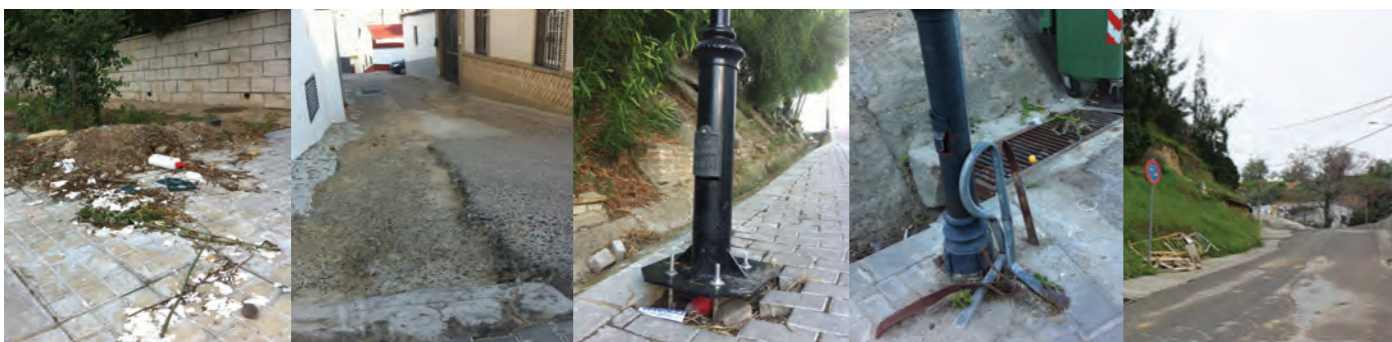
Falta de poda y limpieza C/ Mirador y Acebuche