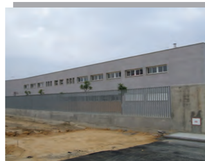
El Colegio Rosa Fdez. sin acceso