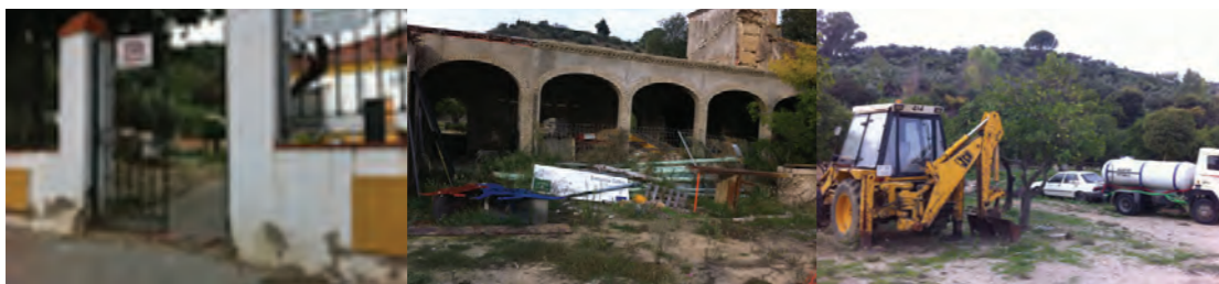
Deterioro de la entrada y vallado