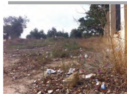
La Cornisa y su parque degradado