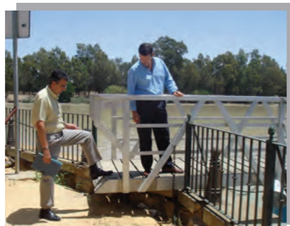
El Puerto... sigue igual