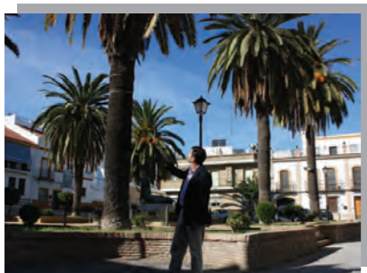
Falta de mantenimiento de palmeras y Plaza Joselito El Gallo.