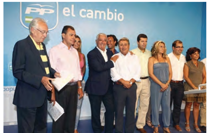
El P.P. Andaluz apoya a Benavente en su propuesta del metro.